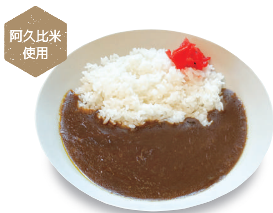
ビーフカレー 800 円