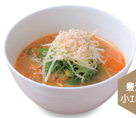
温 豊浜産 エビ塩ラーメン 950 円