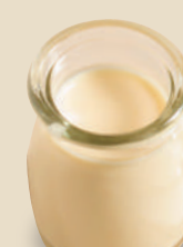
自家製プリン 150 円