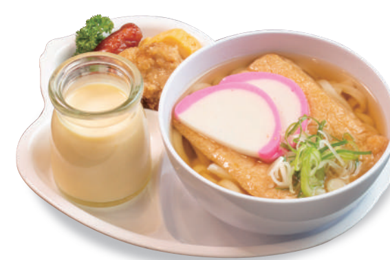
温 ミニうどん 800 円