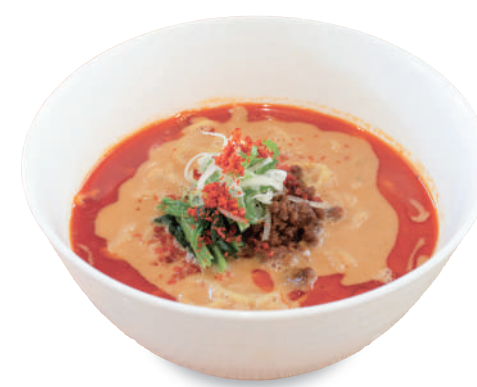
温 ちた食堂の 担々麺 900 円