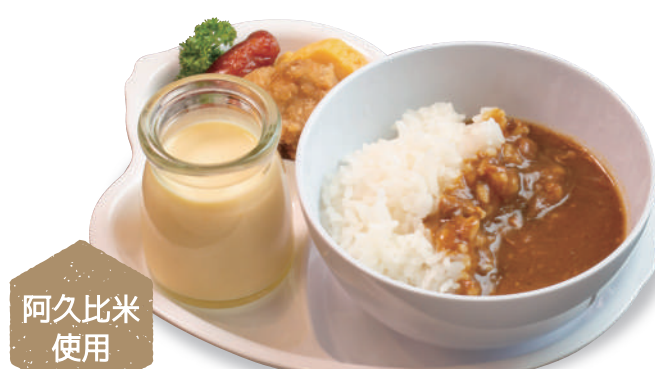
ミニカレーライス 800 円