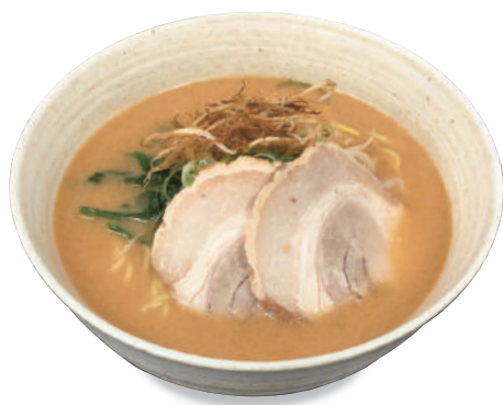
温 濃厚味噌ラーメン 850 円