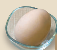
名古屋コーチン生卵 150 円