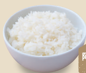
ごはん 200 円