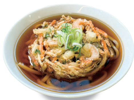
温 かき揚げうどん/きしめん 1100 円