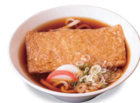
温 きつねうどん/きしめん 800 円