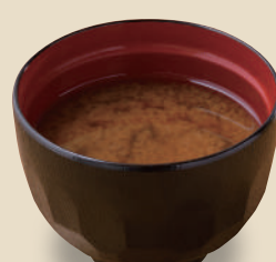
みそ汁 150 円