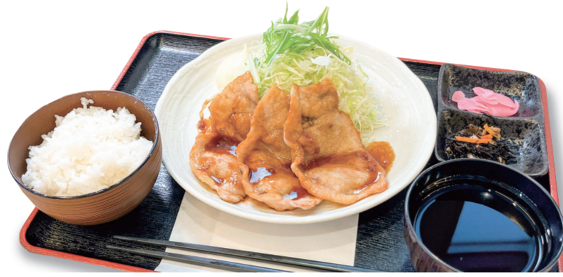
豚しょうが焼き定食 1340 円 特定原材料：小麦・大豆・卵