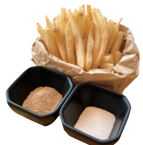
フリフリポテト 350 円 (コンソメ or 塩) 特定原材料：小麦・乳・大豆