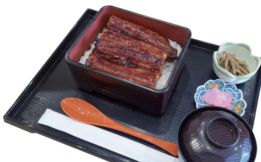
うな重 4300 円 特定原材料：小麦・さば・大豆