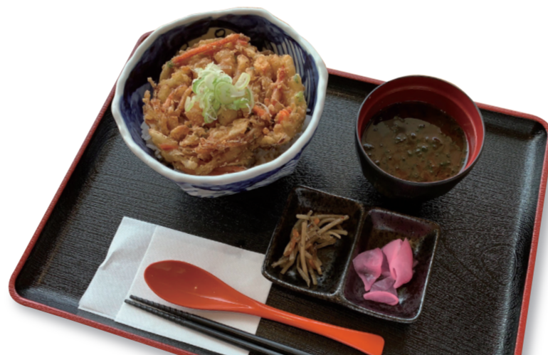
かき揚げ丼 1140 円 特定原材料：小麦・卵・大豆・えび