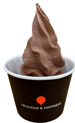
プレミアム チョコレート 450円