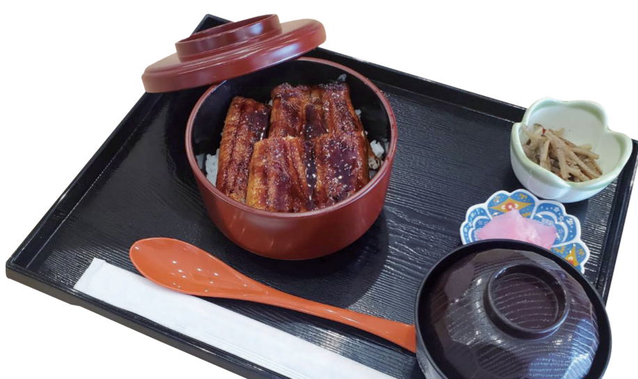
うな丼 3600 円 特定原材料：小麦・さば・大豆