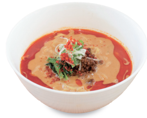
温 担々麺 1300円