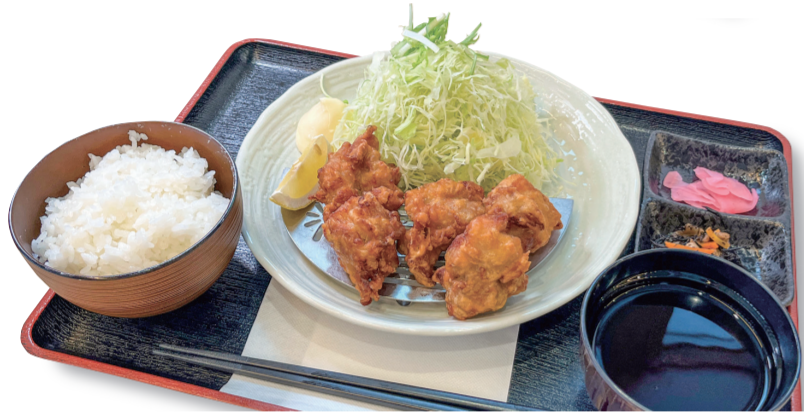
唐揚げ定食 1260 円 特定原材料：小麦・乳・大豆・卵