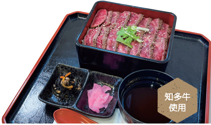
知多牛ステーキ重 2500 円 特定原材料：小麦・大豆