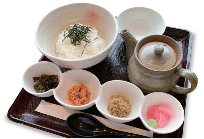
ちりめん茶漬け 1100 円 特定原材料：大豆・えび・かに