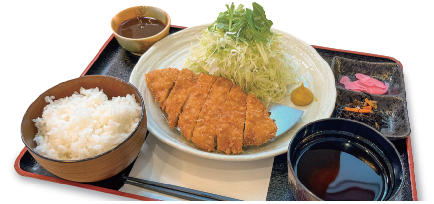
厚切り豚かつ定食 1480 円 特定原材料：小麦・卵・大豆