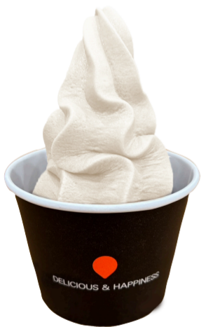
北海道 プレミアムバニラ 450円