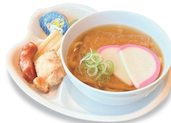
温 ミニうどん 800円