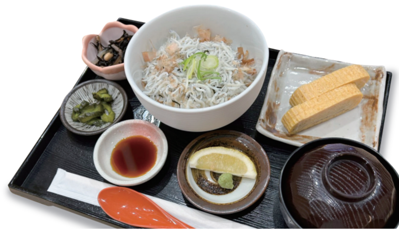
しらす丼 1280 円 特定原材料：大豆・卵・えび・かに