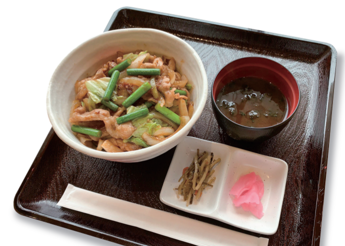
豚バラのスタミナ丼 1200 円 特定原材料：大豆