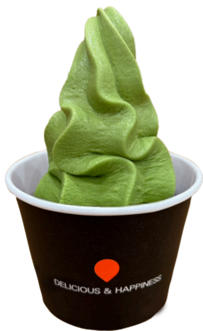
プレミアム 宇治抹茶 450円