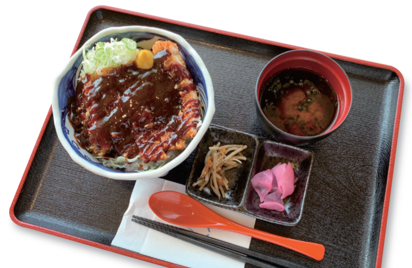
厚切り味噌かつ丼 1240 円 特定原材料：小麦・卵・大豆