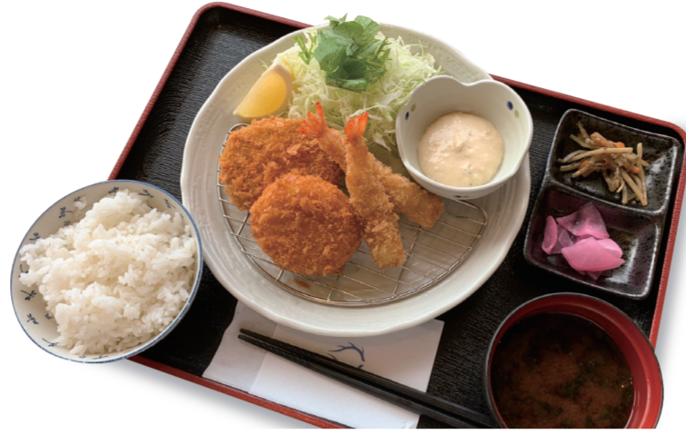
海老コロ定食 1480 円 特定原材料：えび・小麦・大豆・卵