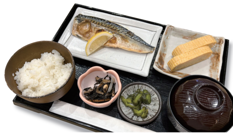
塩さば定食 1330 円 特定原材料：大豆・卵