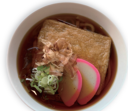
冷 温 きつねうどん/きしめん 830円