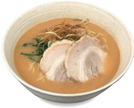
温 濃厚味噌ラーメン 1140円