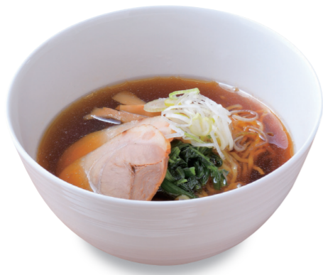
温 醤油ラーメン 1040円