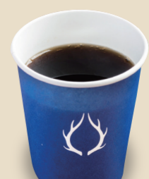
コーヒー (HOT/ICE) 280円