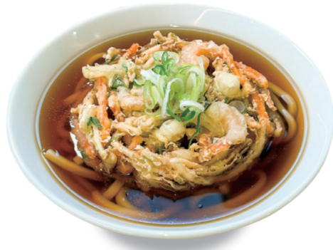
冷 温 かき揚げうどん/きしめん 1000円