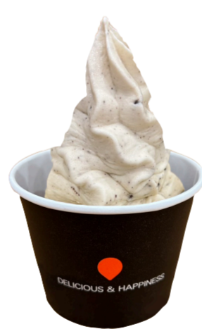
クッキーズ バニラ 350円