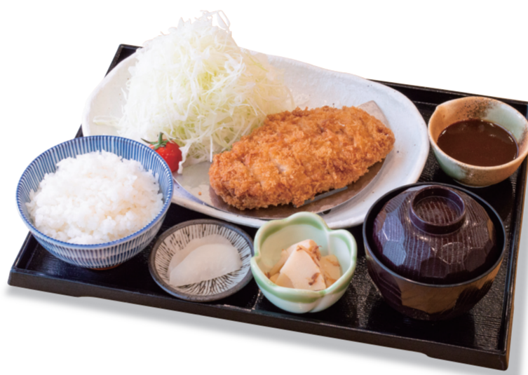
厚切り豚かつ定食 1480円