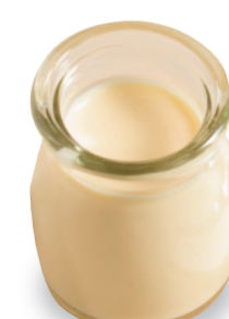
自家製プリン 180 円