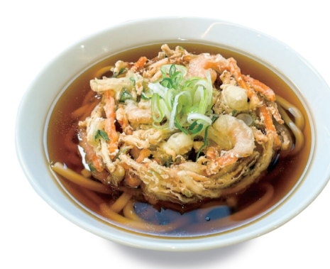
冷 温 かき揚げうどん/きしめん 1000 円