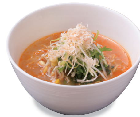
温 豊浜産エビ塩ラーメン 1300 円