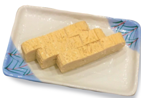
玉子焼き 300 円