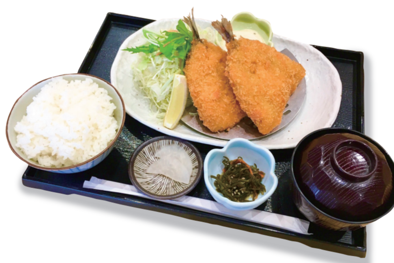
アジフライ定食 1430円