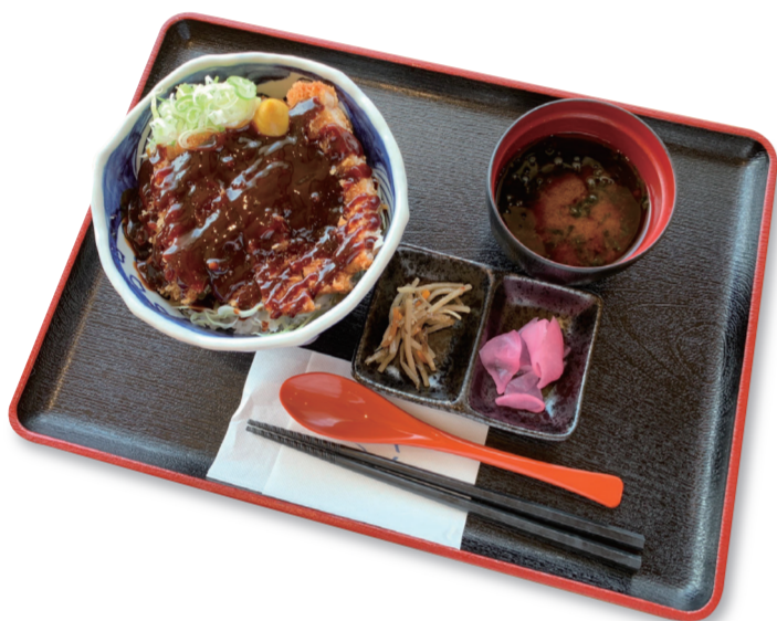
厚切り味噌かつ丼 1240円