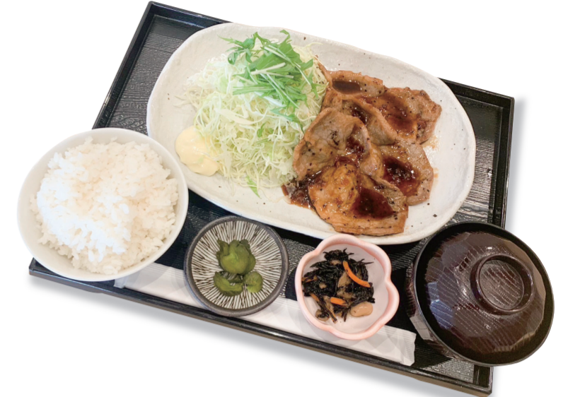
豚しょうが焼き定食 1340円