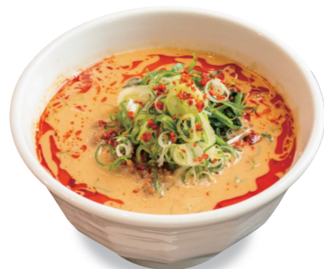
温 担々麺 1300 円