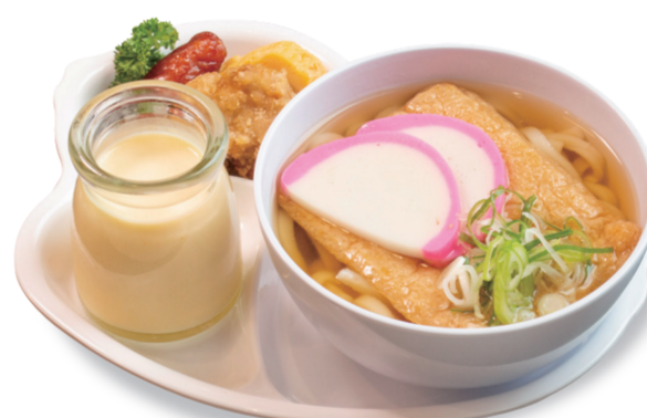
ミニうどん 800 円