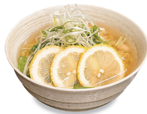
温 レモン塩ラーメン 1040 円