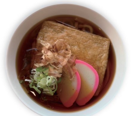
冷 温 きつねうどん/きしめん 830 円