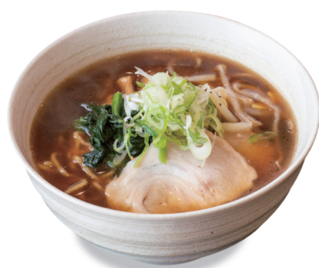
温 醤油ラーメン 1040 円