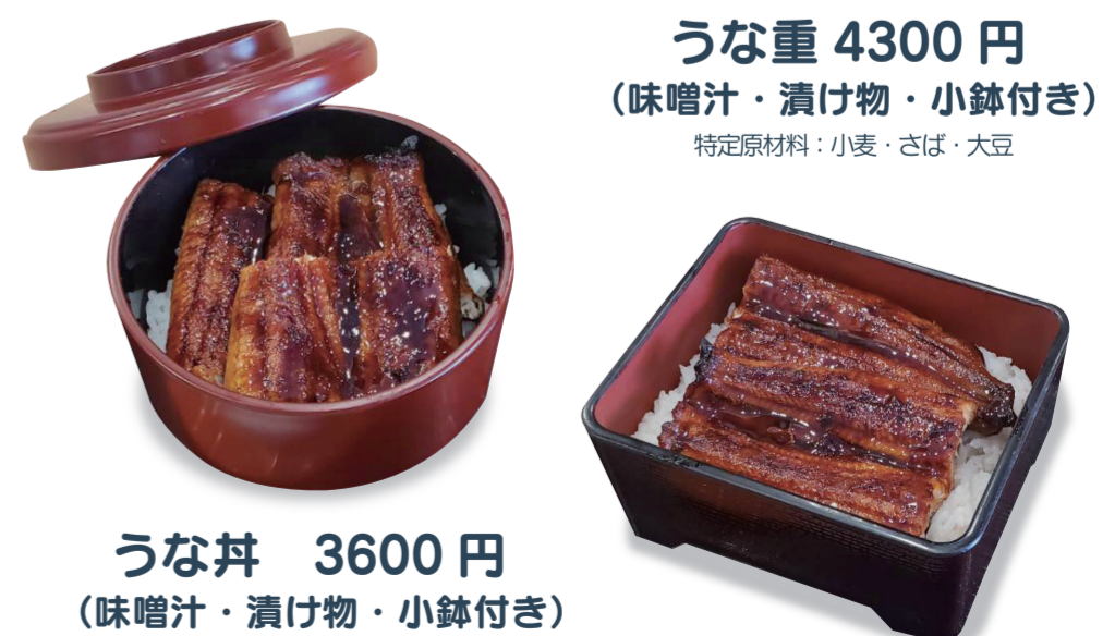
うな重 4300円 (味噌汁・漬け物・小鉢付き) 特定原材料：小麦・さば・大豆