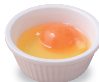
生卵 120 円